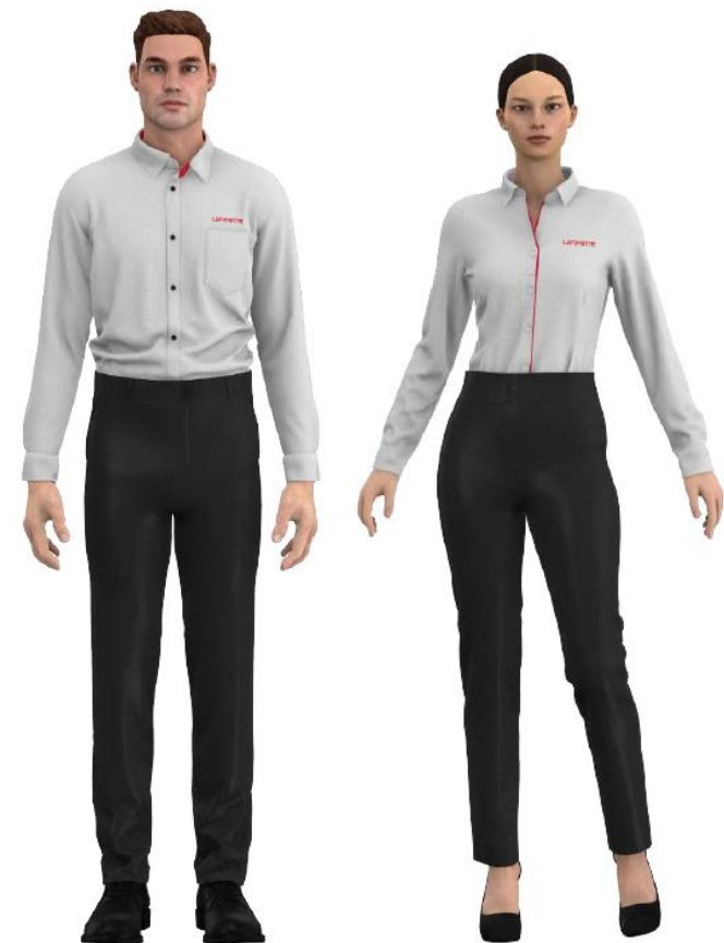
MARTES Y JUEVES GRIS