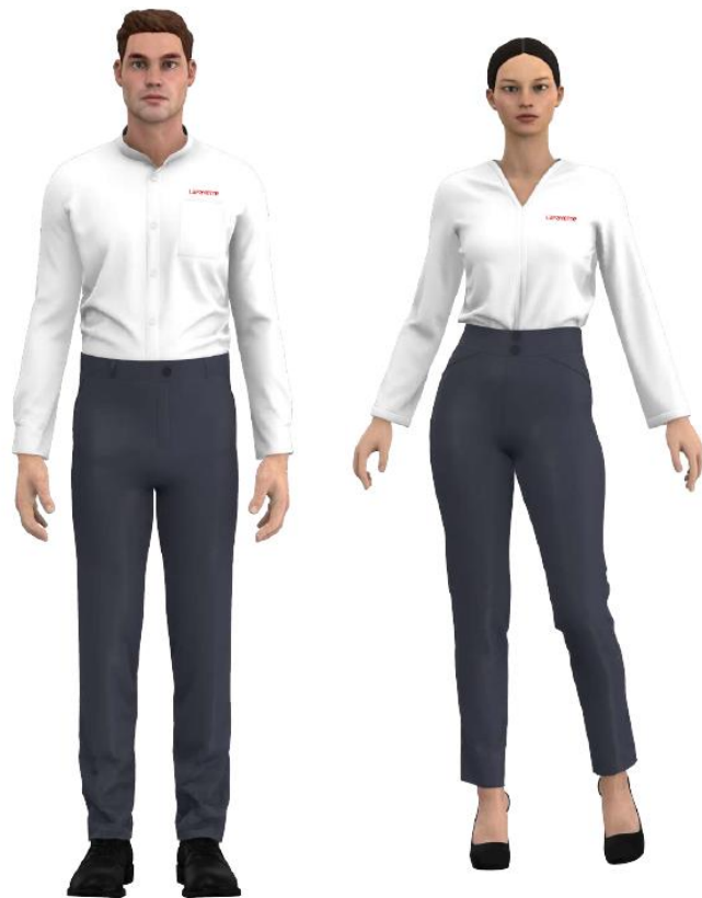
LUNES, MIÉRCOLES Y VIERNES BLANCO